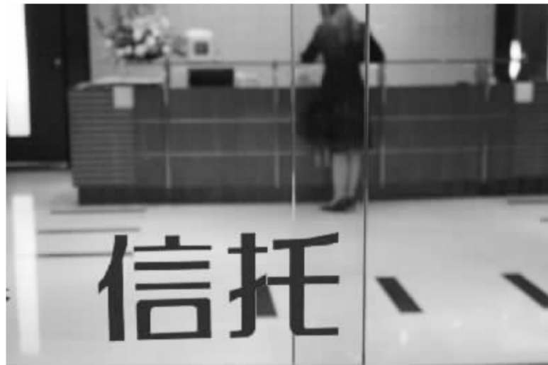
会议还透露,截至2008年11月末,全国54家信托公司的固有资产达871.08亿元,管理的信托财产余额达13325亿元,实现净利润90.74亿元。

银监会副主席蔡鄂生在会上则指出,今后两年信托公司要着力提升资本实力,提足拨备和赔偿准备,提高自身抗风险能力,确保2009年成为信托行业平稳发展年。